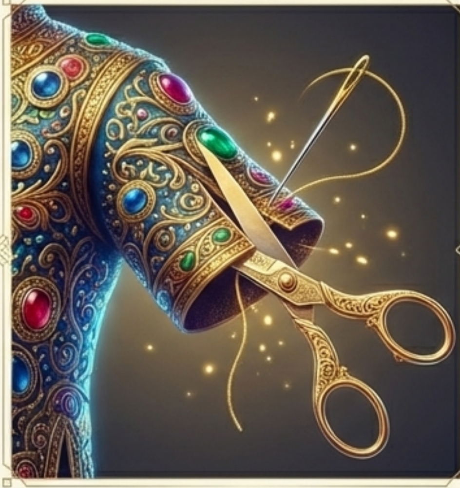
2. Kesme ve Biçme: Her nev'i sanatını göstermek için keser, değiştirir, uzaltır, kısaltır.