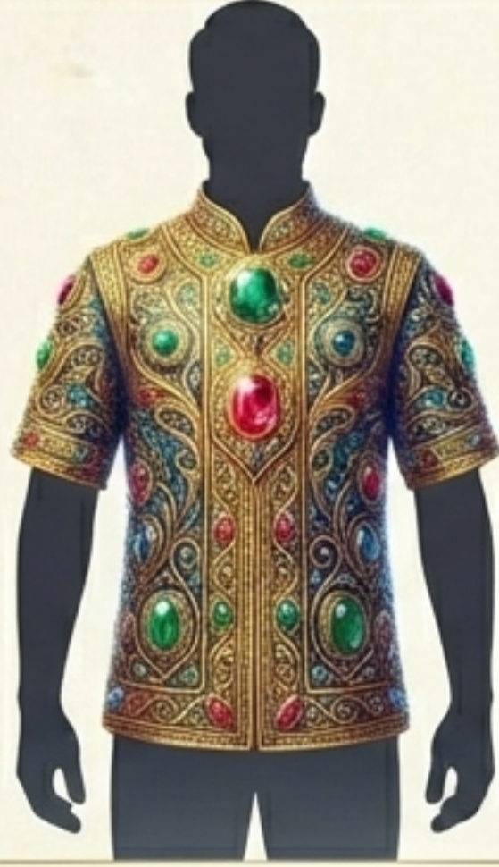
1. Giydirme (Kusursuz ve durağan vaziyet).